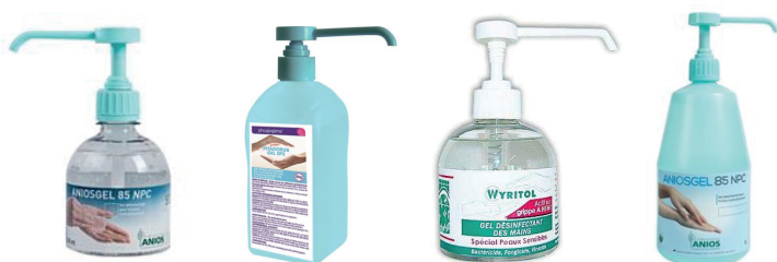
EXEMPLES DE BECS ET FLACONS ADAPTES

3 AVOIR UN FLACON AVEC BEC VERSEUR LONG EST IDEAL Longueur du bec idéal = 60 mm